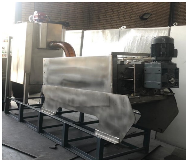
*تصویر فوق مربوط به اسکروپرس تک محوره می باشد